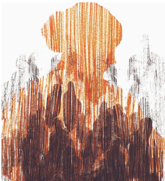
Ilustración de Verónica Durán

La rabia era, todavía, un elemento que tenía más de bruma que de flecha. El resto del alumnado de mi colegio, toda esa masa infante que correteaba por las aceras y los parques de mi barrio, eran apenas sombras que atisbaba en mi ofuscación. Aun así, no se me escaparon los codazos mal disimulados, los pasos atrás, el cerco de seguridad cada día más amplio en torno a mi cuerpo. No estoy seguro de si sentí algo al respecto. Que me percaté de ello, sí; pero no recuerdo ningún tipo de reacción por mi parte. Son escenas que solo he repasado a posteriori, con la nostalgia regalada por los años.